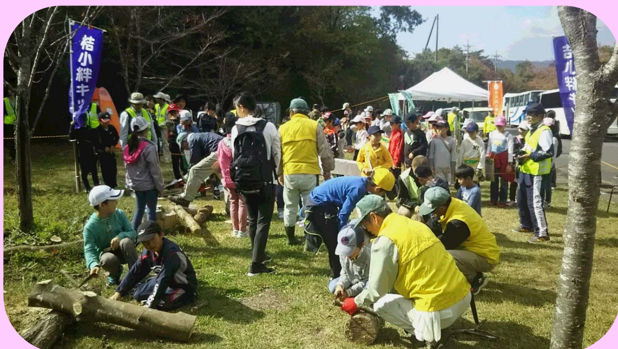
桔梗が丘小学校自然体験学習